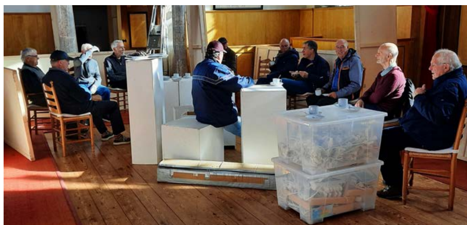
fotobijlschrift: Pauzemoment met koffie en gebak voor de harde werkers