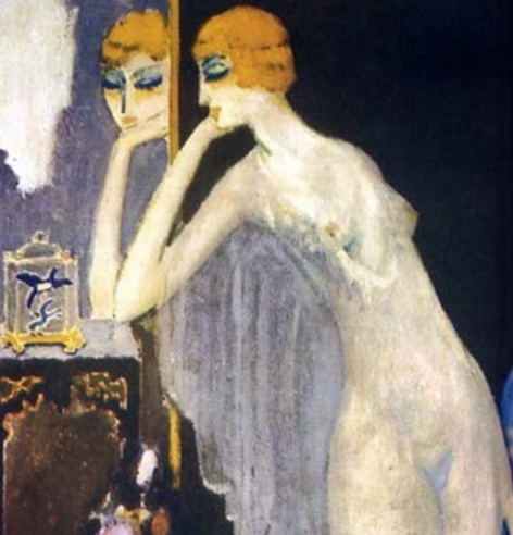
1920s Luisa Casati, een van de schilderijen van Cees van Dongen. (note redactie: vermoedelijk niet het gezochte schilderij)