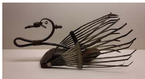
Zwaan met vleugels van een grashark - Jaap de Gijt

Openingstijden en verdere informatie is te zien op: detienmalen.nl