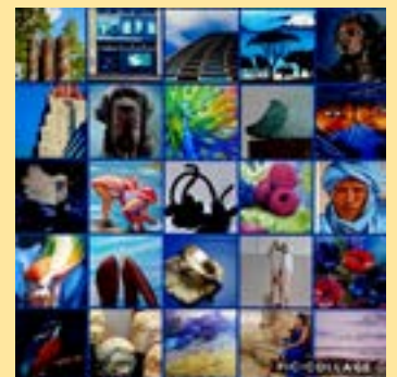
fotocollage gemaakt door Nathalie van Kunst van leden op de website

Mocht u zelf ook interesse hebben uw kunstwerken via deze pagina te laten zien, stuur dan een mail naar info@waddinxveensekunstkring.nl . Hierna wordt contact met u en de webmaster opgenomen om uw interesse waar te maken.